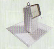
Journaux - Magazines